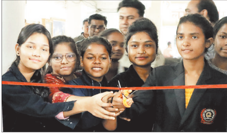
ईवीएम कक्ष का शुभारंभ करती छात्राएं।

विदित हो कि कोरिया जिला कोरबा लोकसभा निर्वाचन के अंतर्गत है। इस जिले में बैकुंठपुर विधानसभा है तथा भरतपुर-सोनहत आंशिक आते हैं। वर्ष 2023 में संपन्न विधानसभा निर्वाचन के दौरान बैकुंठपुर विधानसभा क्रमांक 03 में 228 मतदान केंद्र