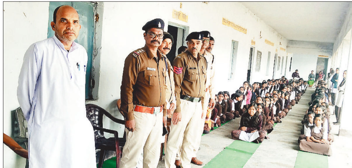
स्कूल में समर्थ अभियान के दौरान विद्यार्थियों को जानकारी देते थाना प्रभारी।