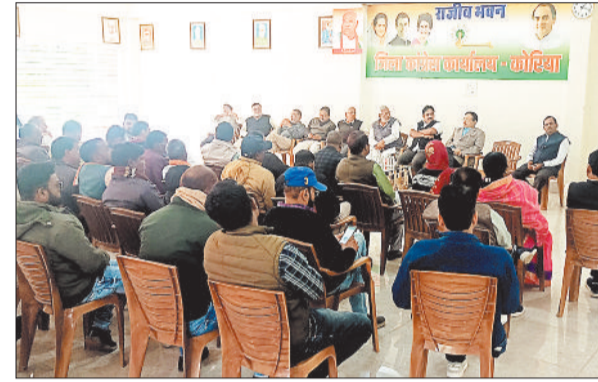
राजीव भवन में आयोजित बैठक के दौरान उपस्थित कांग्रेसजन।

कार्यक्रम का संचालन जिला अध्यक्ष ने किया