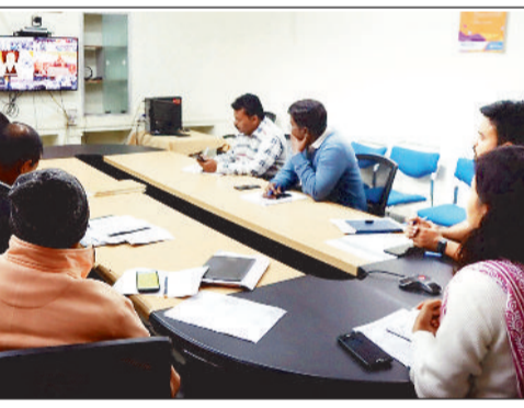
वीडियो कॉन्फ्रेंसिंग में उपस्थित लोग।