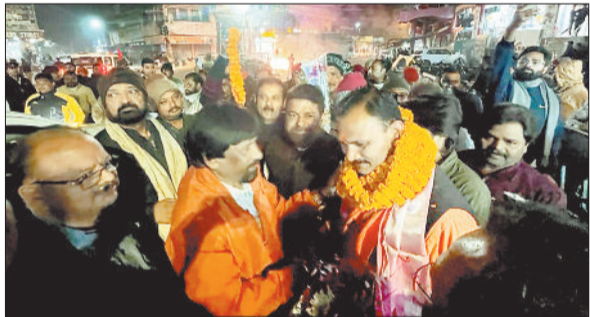
स्वास्थ्य मंत्री का स्वागत करते लोग।