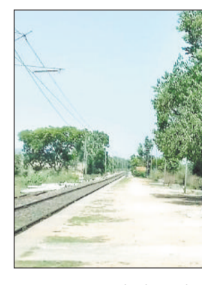
काफी कठिन प्रयासों से इस रेल लाइन को स्वीकृति मिल पाई है, किंतु अब तक रेल निर्माण का कार्य प्रारंभ नहीं हो पाया है।