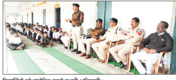
विद्यार्थियों को संबोधित करते प्रभारी अधिकारी।

बैकुंठपुर। कोरिया पुलिस द्वारा चलाए जा रहे समर्थ अभियान के तहत सोमवार के दिन जिले के विभिन्न स्थानों पर में जागरूकता अभियान चलाया गया। जिला मुख्यालय बैकुंठपुर के समीप जामपारा धान खरीदी केन्द्र में लगभग सैकड़ों लोगों की उपस्थिति में था। पटना के धान खरीदी केन्द्र में अनेक लोगों के समक्ष था। चरघा के सरस्वती शिशु मंदिर विद्यालय में बच्चों की उपस्थिति में था। सोनहत के हाईस्कूल सोनहत में समर्थ अभियान के तहत जागरूकता अभियान चलाया गया। जिले में कोरिया पुलिस द्वारा जागरूक कर रही है।