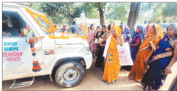
विकसित भारत संकल्प यात्रा का मोबाइल वैन शासन की जनकल्याणकारी योजनाओं का प्रचार-प्रसार गांव-गांव में जाकर कर रहा है।

इसी कड़ी मंगलवार को जिले के मनेन्द्रगढ़ विकासखंड ग्राम भौता, ग्राम पर्सोरी, नारायणपुर विकासखंड भरतपुर के ग्राम कंजिया और ग्राम घटई एवं विकासखंड खड़गवां के ग्राम जाडहरी तथा आमाडांड पहुंचा। विकसित भारत संकल्प यात्रा पूरे देश में सरकार की प्रमुख योजनाओं को प्रत्येक व्यक्ति तक